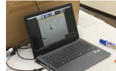
圖為使用ZOOM進行角色設計體驗課。

從8月以來，為韓國、台灣、中國、馬來西亞的同學們舉辦了配音體驗、角色設計體驗課程。為了讓同學們了解將來希望就讀的專業，老師們熱心地向同學