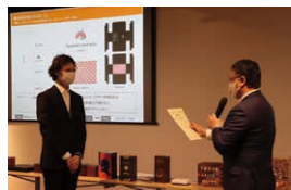
接受最優秀獎的頒發

因為最後向企業進行發表時需要使用日語，雖然事先練習了很多次講稿，當日還是非常地緊張。這是我第一次得獎的設計作品，真的很感動，接下來還會繼續努力爭取獲得更多獎項。」