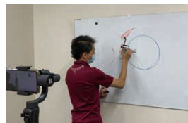
白川老師在教授漫畫角色的畫法。

說明專業內容以及業界狀況。並且由留學生前輩們協助翻譯，讓日語的初學者也能體驗有趣的課程內容。