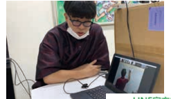
圖為在為韓國的學生OCA的學生!