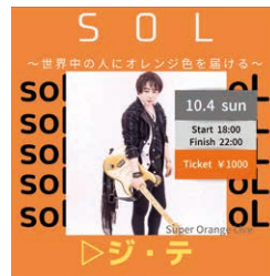
金同學的現場演奏宣傳資料

隨著線上直播技術的發展和社交媒體的廣泛擴散，讓藝術家的表演舞台能夠向世界展開。今後期望包括金同學在內的留學生們，將來都能夠活躍於世界的舞台!