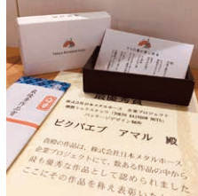
得到採用的作品和獎狀

課題內容是為燻製綜合果仁「TOKYO RAINBOW NUTS」設計外包裝，這個課題是由株式會社日本金屬軟管所提供的。