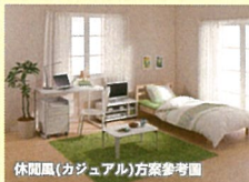
休閒風(カジュアル)方案參考圖

家電4点セット + 家具 + 新生活用品セット 4件家電 + 家具 + 生活用品組