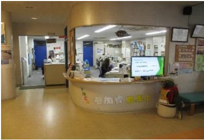
學校接待所櫃檯1樓