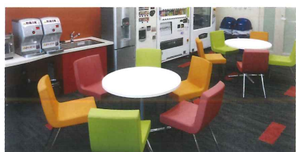
学生ラウンジ Student Lounge (2F・8F) 學生休息室 학생 라운지