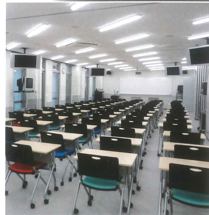
大教室 Lecture Hall (4F・7F) 大教室 대교실