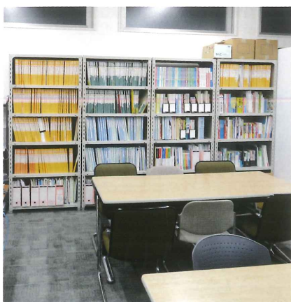
キャリア支援室 Student Support Center (1F) 進路指導室 진로 지도실