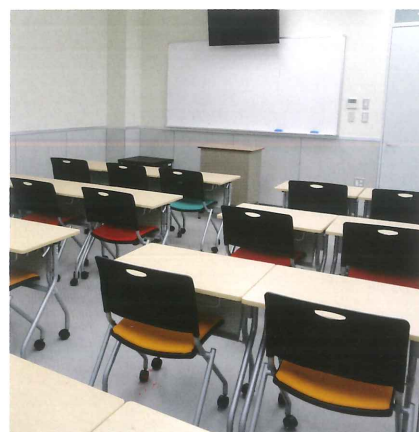
一般教室 Regular Classrooms (4F~7F) 一般教室 일반 교실