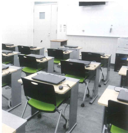
コンピュータ教室／デジタル視聴覚 (L.L.C) 機能付 Computer Training Room / PC-Language Laboratory (2F・2F) 電腦教室／附設有數位視聽 (L.L.C) 機能 컴퓨터 교실 / 디지털 시청각 (L.L.C) 실로 쓰임