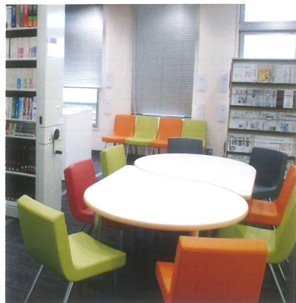
図書室 Library (2F) 圖書室 도서실