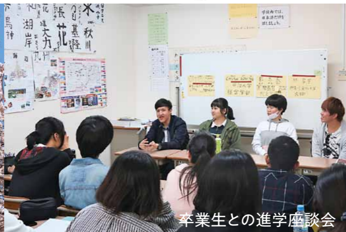
卒業生との進学座談会