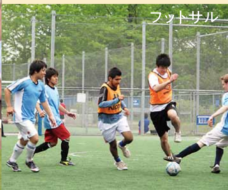
フットサル 板橋駅前噴水