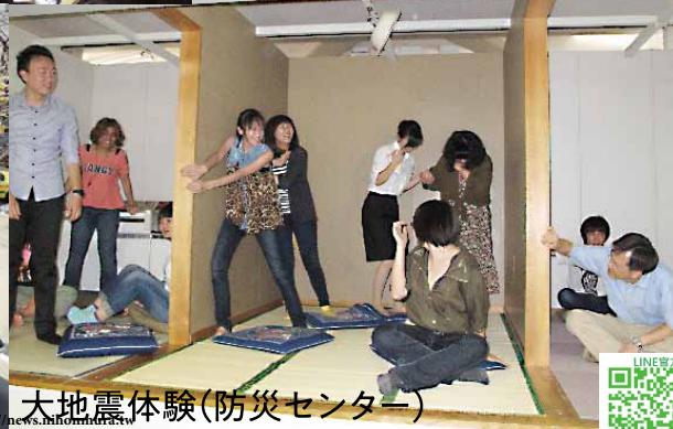
大地震体験(防災センター)

105039 台北市松山区復興北路73號7樓之2 TEL : (02)8772-7977