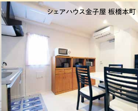
シェアハウス金子屋 板橋本町