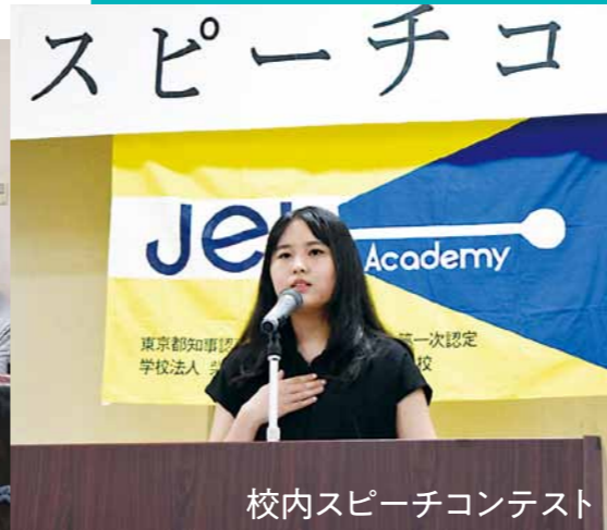
校内スピーチコンテスト