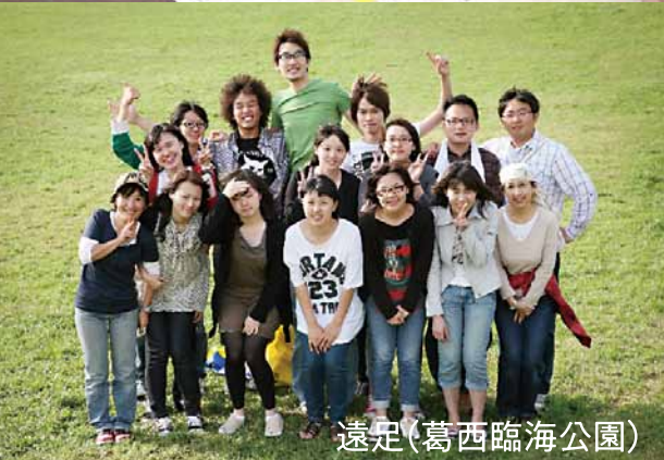
遠足(葛西臨海公園)