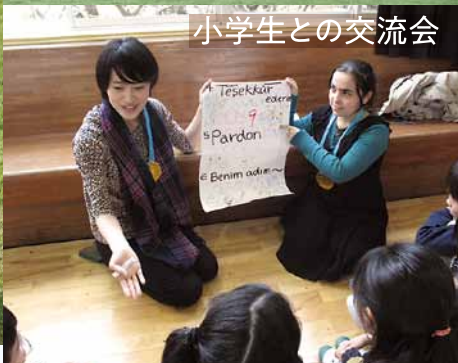
小学生との交流会