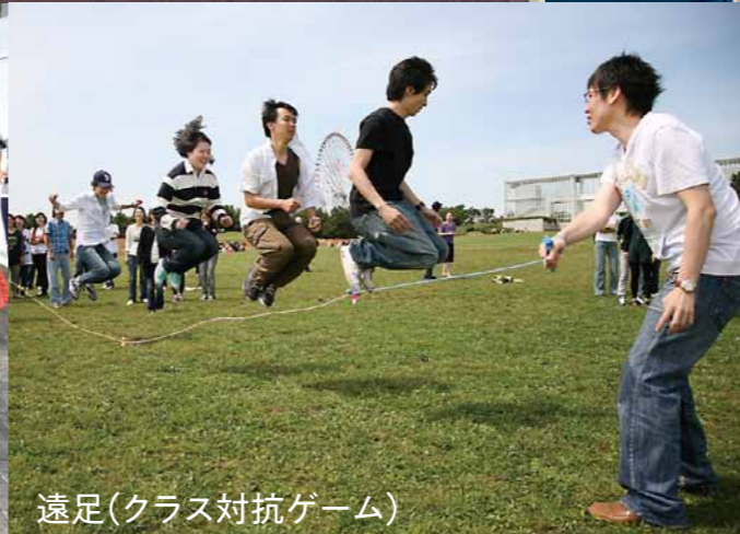
遠足(クラス対抗ゲーム)